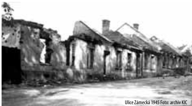
Ulice Zámecká 1945