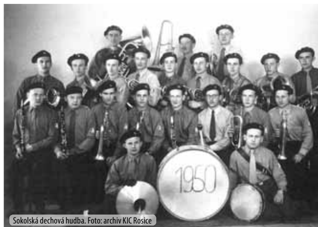
Sokolská dechová hudba.