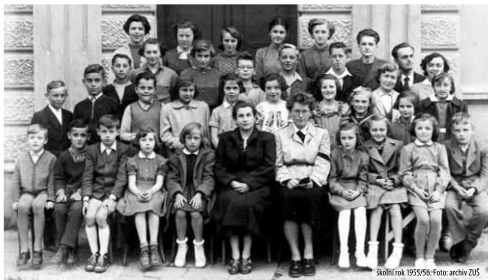
Školní rok 1955/56.