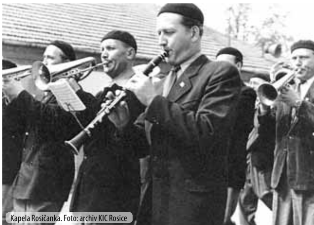
Kapela Rosičanka.

SELÝ, který hrával i na housle a violoncello.