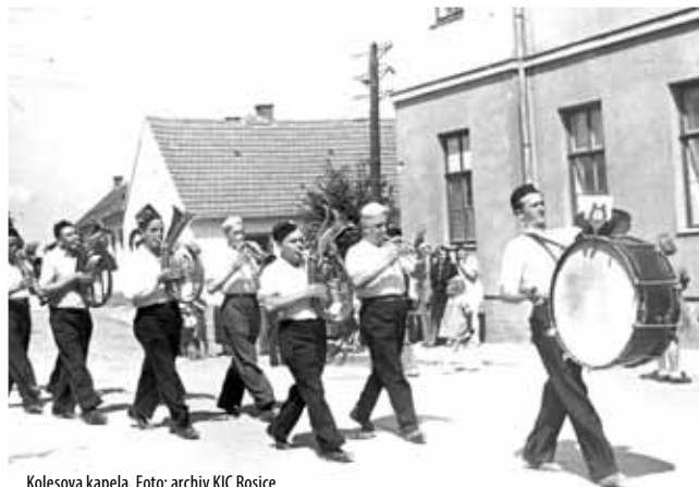
Kolesova kapela.

Soubor se zúčastnil v roce 1950 soutěže dechových hudeb v Oslavanech, kde zvítězil a postoupil do krajského kola. Zde opět zvítězil, což svědčí o mimořádné kvalitě souboru i kapelníka.