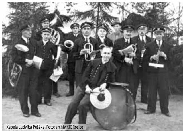
Kapela Ludvíka Pešáka.