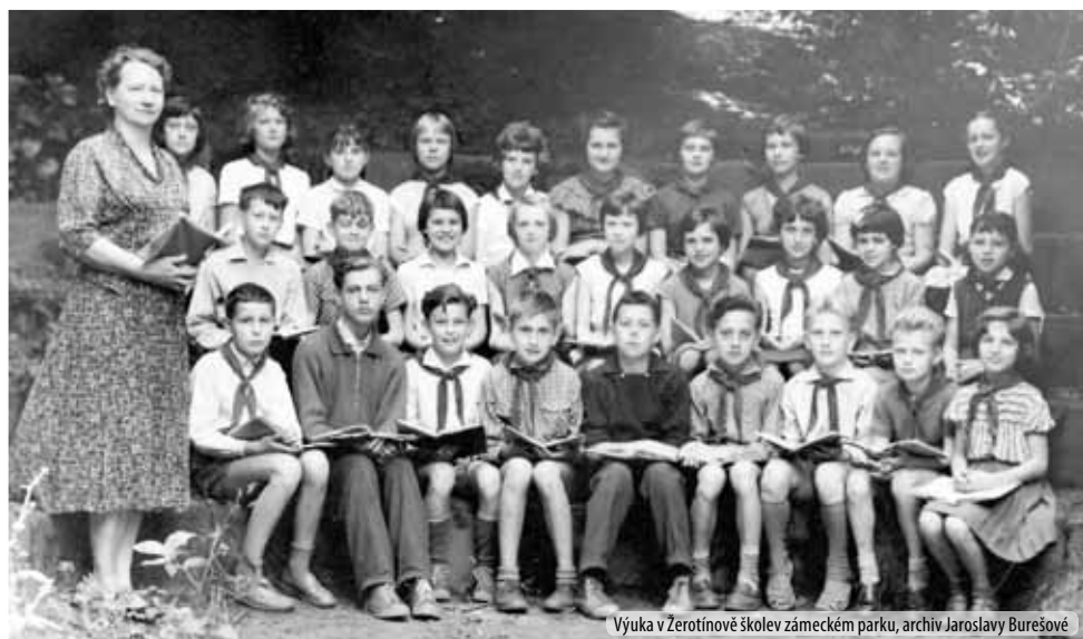
Výuka v Žerotínově školev zámeckém parku

Fotografie z roku 1959 zachycuje výuku v tzv. Žerotínově škole, která byla k těmto účelům využívána a zároveň udržována do první poloviny 60. let.