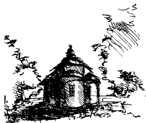
autor: Michal Štourač