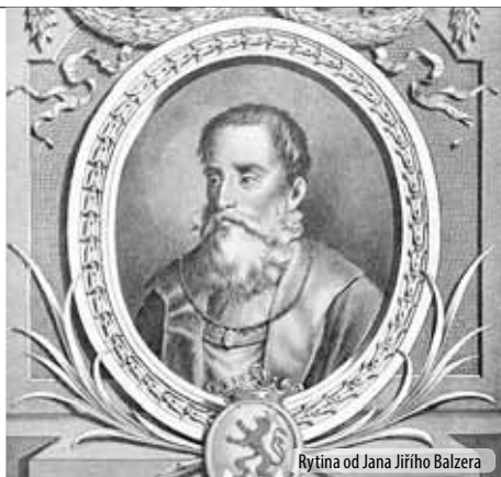
Rytina od Jana Jiřího Balzera