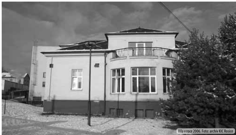
Vila v roce 2006.