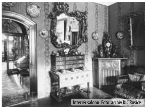
Interiér salonu.