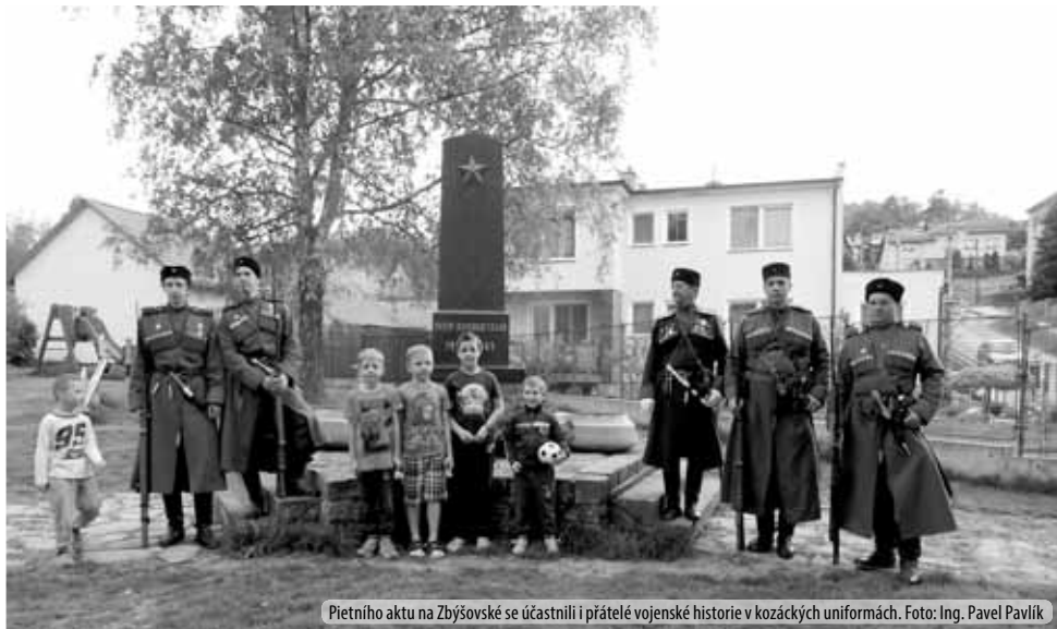
Pietního aktu na Zbýšovské se účastnili i přátelé vojenské historie v kozáckých uniformách.