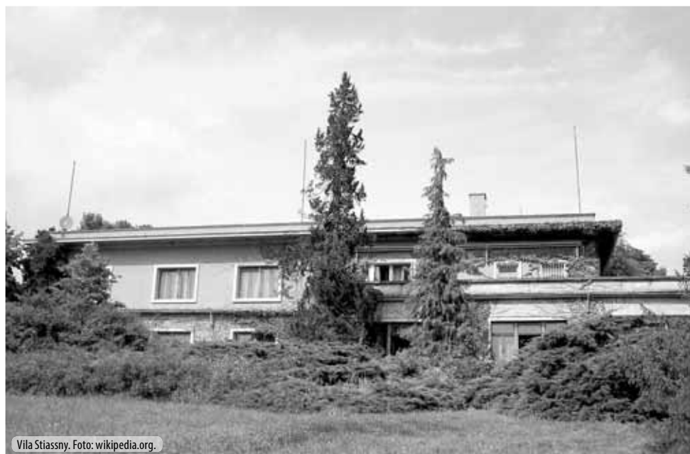
Vila Stiassny.

le a posléze Vyšší průmyslové škole. Jeho další studia již probíhala ve Vídni. Coby mimořádný posluchač navštěvoval