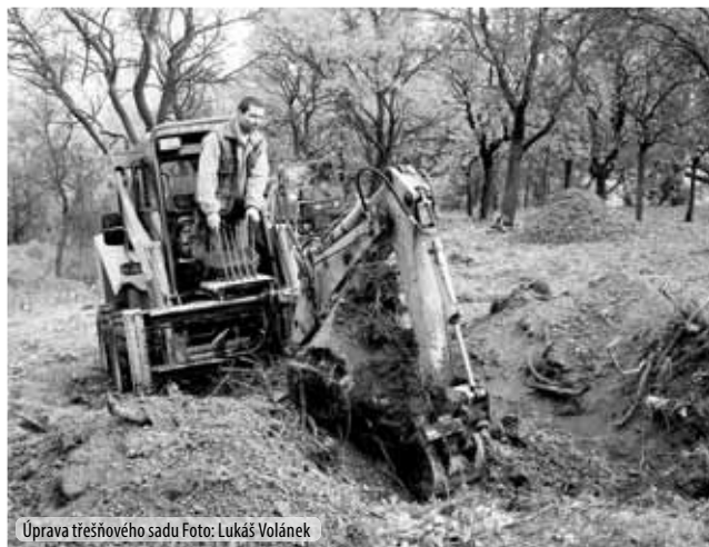
Úprava třešňového sadu

opravdu podařilo, až na koutek u Bobravy naproti Penamu, který by zasluhoval zlepšení, a to v rámci komplexnějšího řešení celého nábřeží. Nyní je nabídka míst, kde si děti mohou hrát, mnohem pestřejší a za to bych tady chtěla poděkovat nejen vedení města, ale i těm aktivním spoluobčanům, kteří neváhali přiložit ruku k dílu a zaneřáďená prostranství přeměnit v místa, kde je možné si odpočinout a děti mají dostatek prostoru pro své outdoorové aktivity.