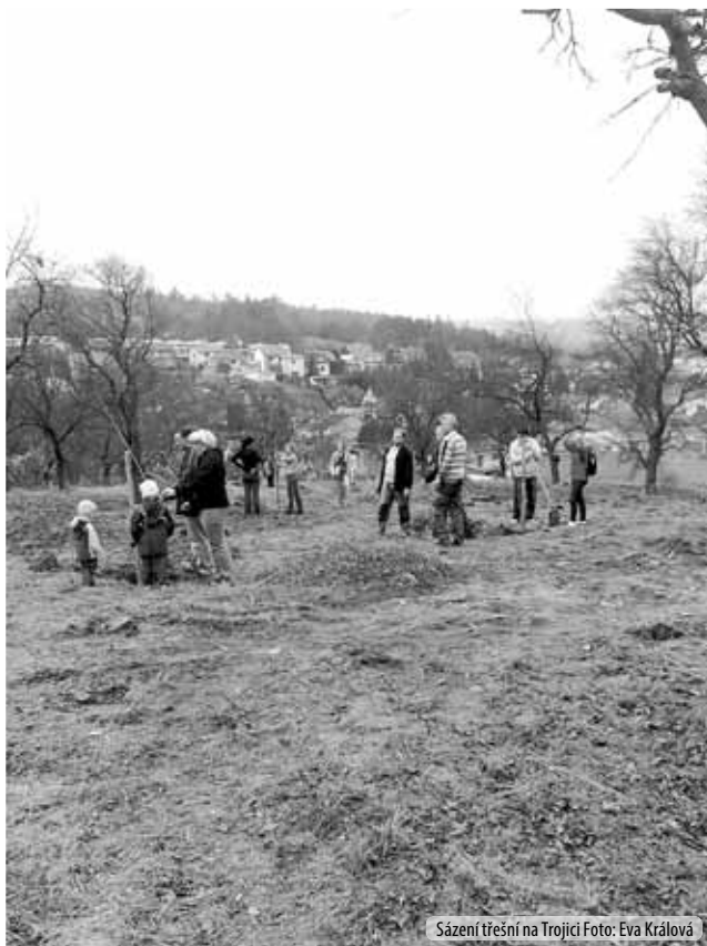
Sázení třešní na Trojici