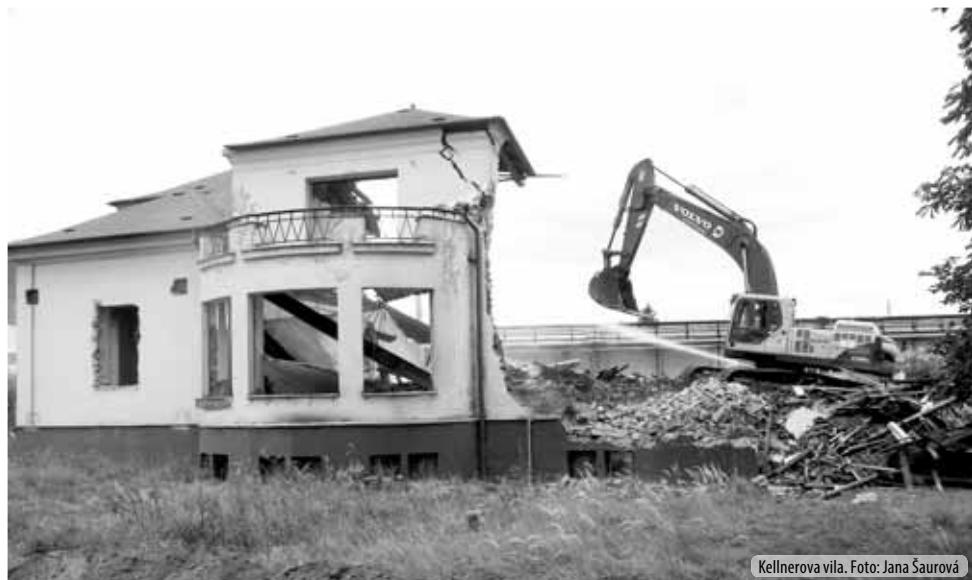
Kellnerova vila.