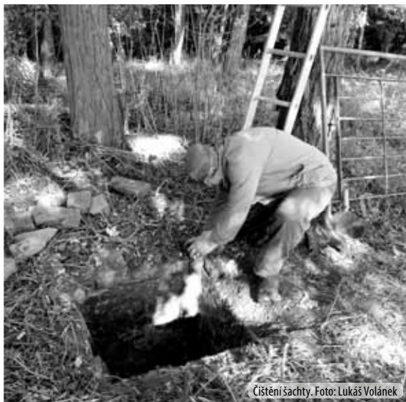
Čištění šachty.

ODVZDUŠŇOVACÍ ŠACHTY – byly součástí druhého rosického vodovodu z 18. století. Jediná zachovaná se nachází na jižní straně Obory na okraji lesní stezky vedoucí od malého parkoviště ležícího naproti rodinnému domu Liškových k haltýři. Šachta je vyzděna z cihel s patrnými zbytky vápenné omítky. Dno šachty je ponecháno hlíněné. Světlost šachty je 800x800 mm a původně byla kryta dřevěným víkem. Litinové potrubí o průměru 70 mm je uloženo v hloubce 1400 mm. Odvzdušňovací zvon je k potrubí připevněn navrtávkou. Součástí zařízení odvzdušňovací šachty je šoupátko, které je připevněno přírubovým spojem. Ostatní spoje původního potrubí byly pravděpodobně provedeny systémem trubka – hrdlo utěsněné čevěným tmelem.