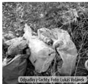
Odpadky z šachty.