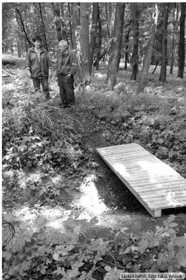
Lávka k haltýři.