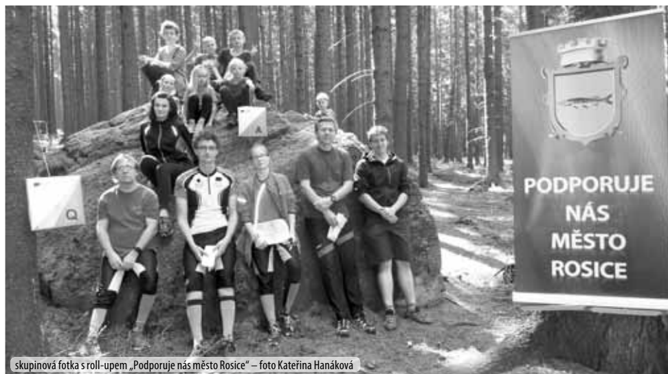
skupinová fotka s roll-upem „Podporuje nás město Rosice“

V závěru prázdnin jsme uspořádali pětidenní soustředění v Tisí na Děčínsku, jehož součástí byly čtyřetapové závody ve výjimečných terénech – pískovcových skalních