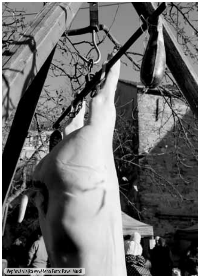
Vepřová vlahka vyvěšena

Vyvěsili vepřovou vlahku. Vývar vaří, vybublává. Velká vůně vylákala všechny ven. Vagabund Víťa vylizuje várnici. „Vítáme vzácné veležrouty,“ volá víla Viola. „Vepšové variacie vy vy vyzerajú výtečno,“ vykottává vlastenec Vaňo. Velkopřumyslník vypadá velmi vzburzeně. Vstával čas.