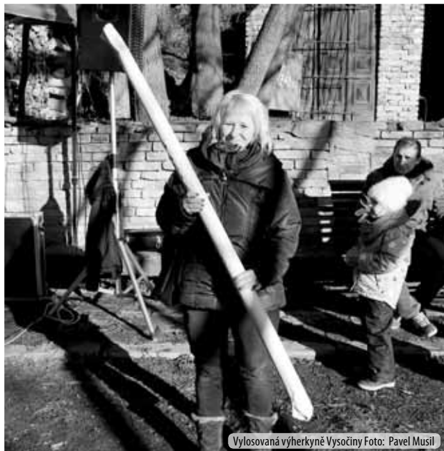
Vylosovaná výherkyně Vysočiny

Výčepní Volánek vylévá vařené víno. „Vybryndávají výhradně vyvrhelové!“ vyřvává vandrák Venca. Vařený vermut voní Vánocemi. Vyškovští vojáci vypili veškerý včelí výluh,