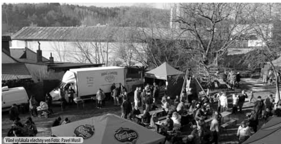
Vůně vylákala všechny ven