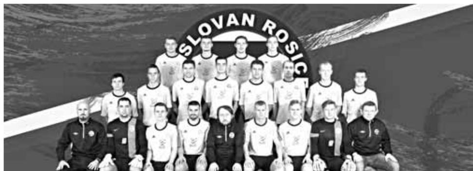
FC Slovan Rosice – „A“ tým (sezóna 2016/17)

Složení realizačního týmu zůstává beze změn. Hlavním trenérem týmu je Michal Kugler, asistentem Petr Čejka, trenérem