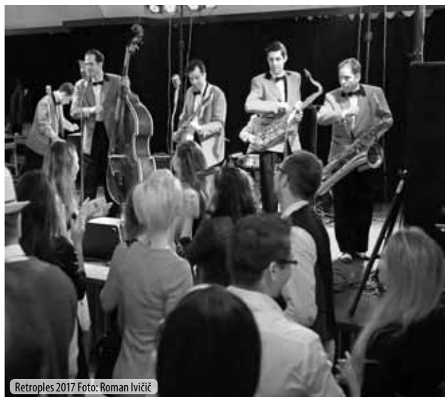
Retroples 2017