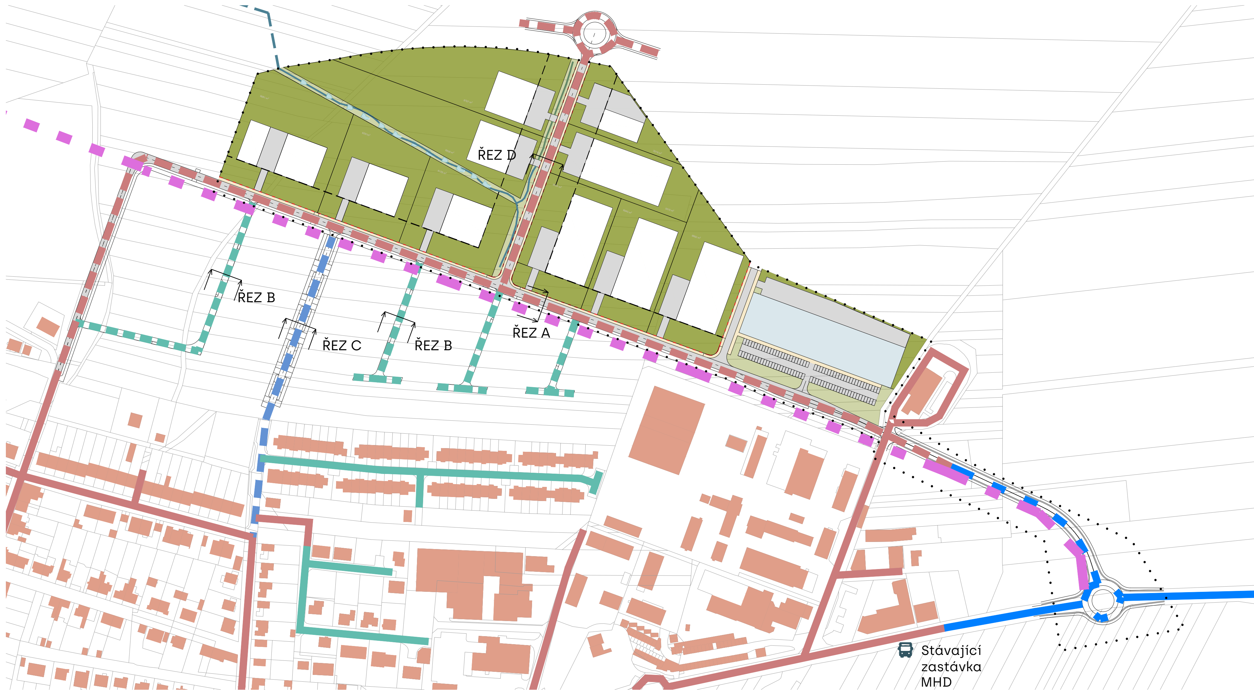
ŘEZ PÁTEŘNÍ KOMUNIKACE A-A'