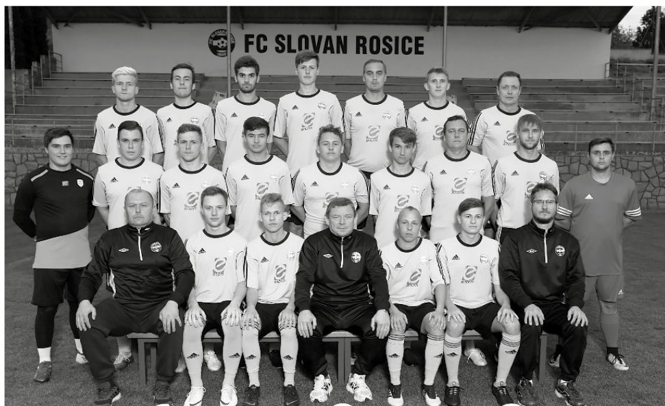
„B“ tým FC Slovan Rosice

„B“ tým mužů a dorostenecké týmy zahájily zimní